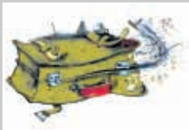
A sinistra, Paolo Rossi durante uno spettacolo degli anni scorsi a Sassari. Sopra, il logo del festival «La valigia dell'attore» che ospita il laboratorio dell'artista milanese

Da domani alla Maddalena con un corso di recitazione