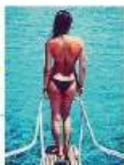
Canalis in barca a Stintino