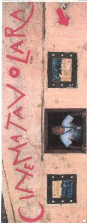
1. L'Angel Quartet a Berchidda per Time in Jazz. 2. Musica e non solo al festival Isole che parlano di Palau. 3 e 4. Istantanee dai festival del cinema di Tavolara, evento di grande richiamo. 5. La processione della Discesa dei candellieri, a Sassari. 6. Una fase della cavalcata dell'Arcida, a Sedilo. 7. Concerti al tramonto in riva al mare a Palau. 8. Time in Jazz.

dal 9 al 15 settembre Isole che parlano (festival musicale) Il festival offre un ultimo assaggio delle immagini e dei suoni che danno alle tradizioni della Sardegna un respiro contemporaneo ed europeo. Concerti al tramonto, workshop creativi, incontri tesi a creare un equilibrio poetico tra arte e natura sono il cuore dell'iniziativa, con eventi dislocati tra Palau e i monumenti naturali, le spiagge, i siti archeologici e l'arcipelago della Maddalena. INFO: 0789/70.95.48; www.isoleche parlano.it