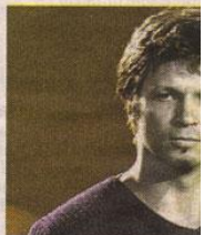
Il musicista Bertrand Cantat

A dieci anni d'Trintignant, scontato un acido, Bertrand un nuovo alt