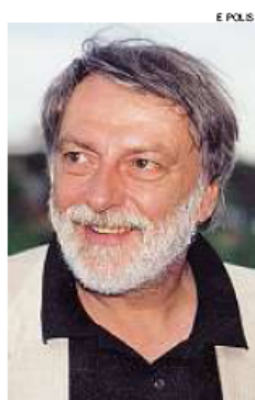
► Gino Strada

tro pediatrico di Bangui, aperto ventiquattro ore su ventiquattro, offre assistenza sanitaria gratuita ai bambini fino a 14 anni e attività di educazione igienico-sanitaria. A sostegno di questo progetto il Gruppo Emergency di Alghero da appuntamento al Poco Loco Music Club. Al costo di 15 euro, di cui 7 interamente devoluti ad Emergency, sarà possibile gustare pizza e bibita in compagnia. ■