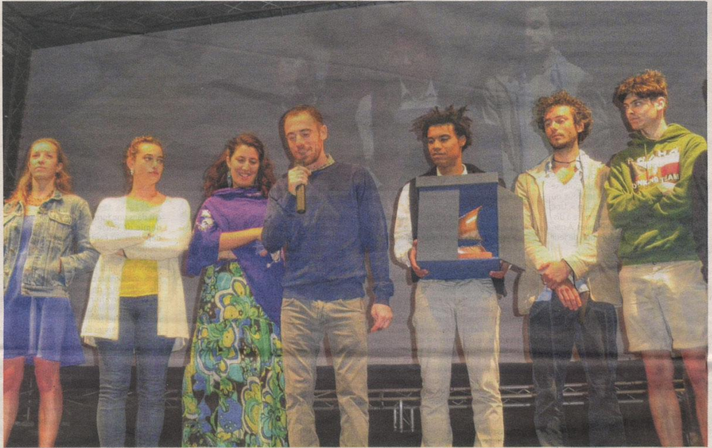
Elio Germano sur la scène de La Valigia, au milieu des élèves acteurs de sa master class.