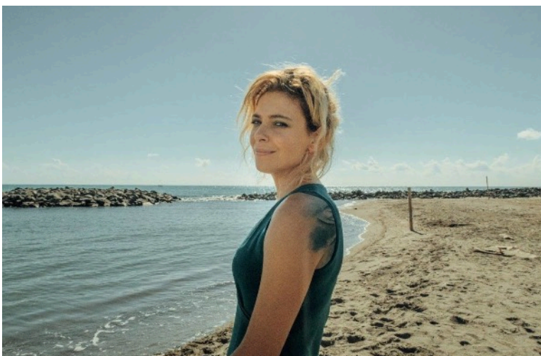
Jasmine Trinca in "Fortunata"