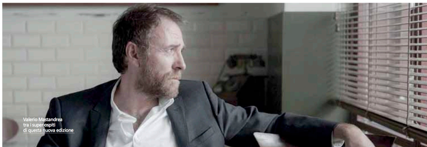
Valerio Mastandrea tra i super ospiti di questa nuova edizione

Nadia Toffa torna, dopo un mese, sui social: «Oggi mi faccio carina, per me». Sta combattendo contro un tumore.