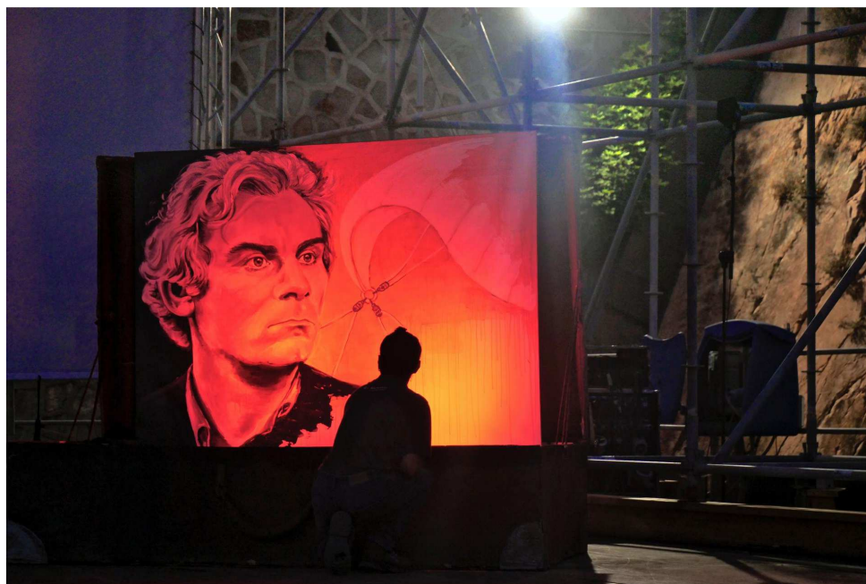
Dipinto Volonté di Tina Liodice, foto di Ugo Buonamici

L'edizione 2020 de La Valigia dell'attore è realizzata con il sostegno e patrocinio di MIBACT – Direzione Generale Cinema, Regione Autonoma della Sardegna – Assessorato alla Cultura e Assessorato al Turismo, Comune di La Maddalena, Ente Parco Nazionale Arcipelago di La Maddalena, Fondazione Sardegna, NuovolMAIE, Artisti 7607 e la collaborazione della Scuola d'arte cinematografica Gian Maria Volonté e dell'Istituto Alcide Cervi.